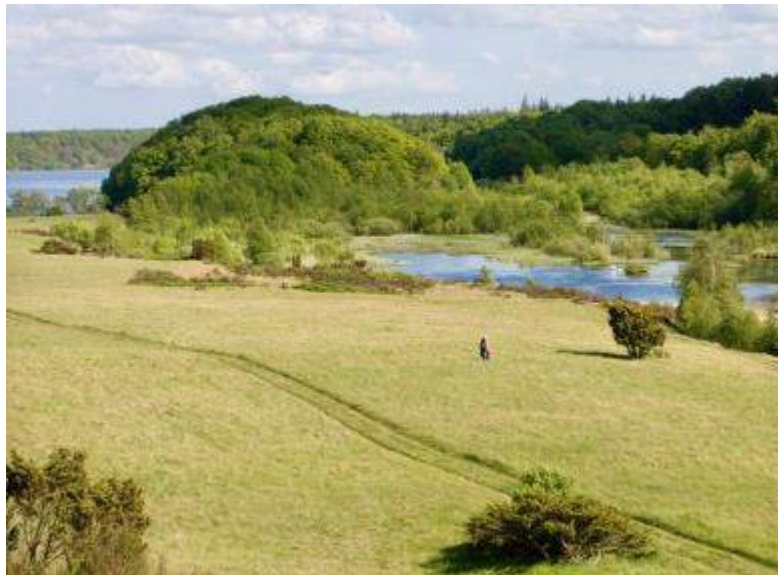
Fårebanke. Foto fra Naturstyrelsens folder: Rørbæk Sø

En forårstur hvor vi både ser på forårsbebuderne blandt planterne, lytter og bestemmer fuglestemmerne og helt uafhængigt af årstid og vejr - som altid - nyder et flot landskab. Turen starter ved Ballesbækgård, går over Kælderbanke, videre på åsen Fårebanke og tilbage gennem Rørbæk Skov, dvs. lidt hede, meget overdrev og til slut skov - og næsten hele tiden med udsigt til Rørbæk Sø i tunneldalen.