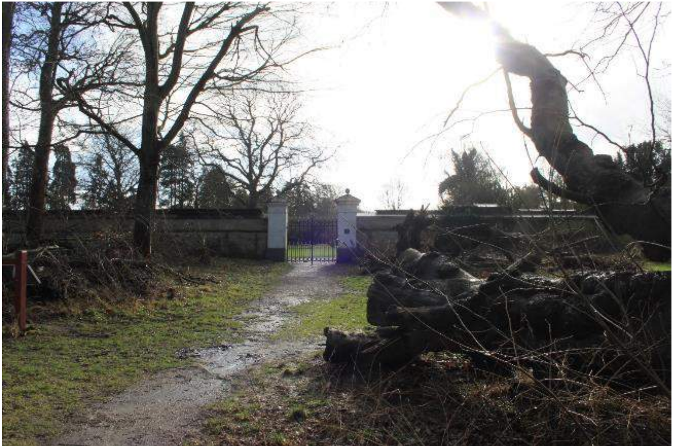
Indgangen fra Boller Nederskov til slotsparken

Dagens vandretur fører os ind i den kongelige jagtskov ved Boller. Naturhistorie og kulturhistorie bliver fælles nærværende så tæt på købstaden og et slot.